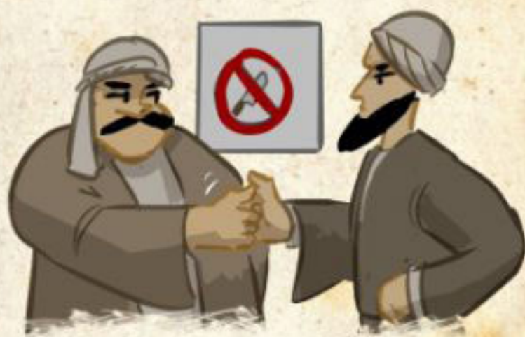
منع قتل‌های انتقامی

شاه و ملکه سرشار از اعتماد به نفس، به راه افتادند تا متحدان بین‌المللی‌ای را نیز جلب نمایند.