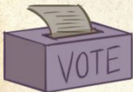
حق رای زنان