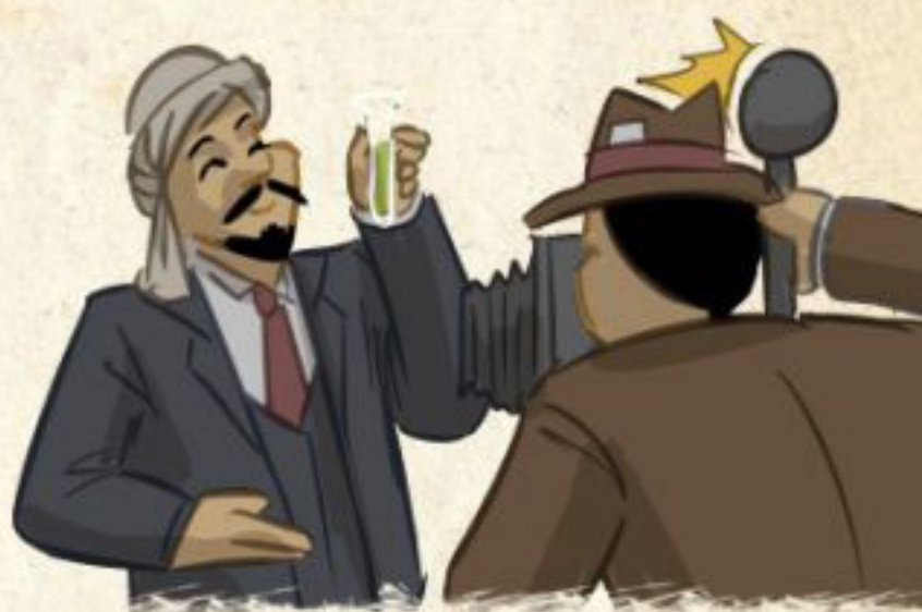
ترویج روزنامه‌نگاری و علم