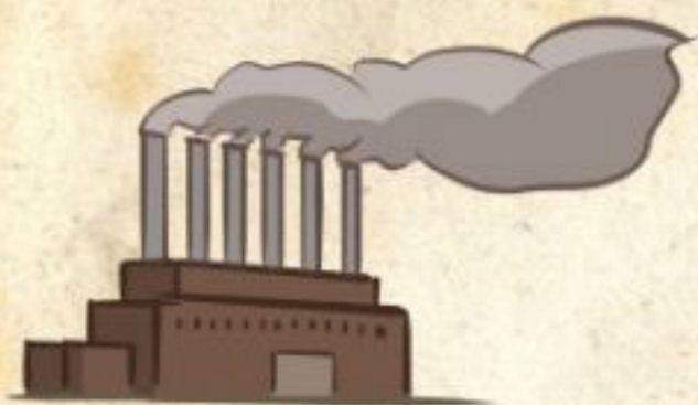
نیروگاه‌های جدید برق

هر دو با سرعت فوق العاده ادامه دادند. اهداف شانرا سریعاً به ثمر می‌نشانند.