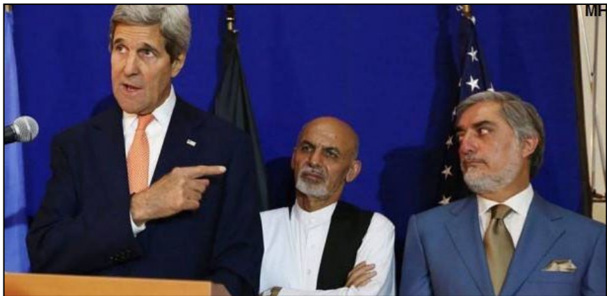
د امریکایی ارباب پر وړاندی په ذلیل توب سره د عبدالله او اشرف غنی د خم سړی له صحنو څخه.

خلکو په منځ کې بی‌باوره شوی، اوس ددی نوبت دی چې د «ملي یوالی» اصطلاح هم په چټلې ولري. د «افغانستان د همبستگي گوند» لا دمخه وړاندوینه کړې وه چې د نیواک د سیوري لاندی او د نړی تر ټولو فاسد هیواد چې په هغې کې ستم کونکی او د مافیا مشران کډون ولری، ټاکنی په دموکراسۍ ملنډې وهل او د پردیو غلامانو ته قانونی بڼه ورکولو معنی لری. ډیر لږ خلک په دی خبره و نه پوهیدل او د رای په ورکولو سره یی، خپلی رنگ شوی گوتې په افتخار اوچتی کړی. همدغو خلکو هم ورسته له دی چې وی لیدل د ټاکنو د لانجی د هواری لپاره خو واری جان کری له امریکا راغی او دواړه نوماندان لکه د برده په خیر د هغه شاوخوا راتول شول و پوهیدل چې په یوه مسخره لوبه کې ترینه ناوړه گټه پورته شوی او له دی امله د شرم او پښیمانی احساس کوی. نور نو هغه خلک چې سیاسی هم ندی په دی پوهیږی چې ددوی رای هیڅ ارزښت نلری او هغه څوک چې «سپینه ماڼی» وغواړی په څوکی کینوی.