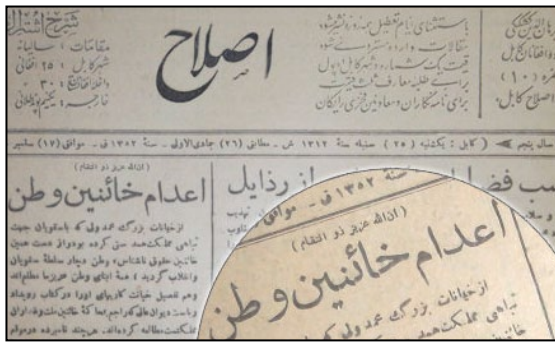
د «اصلاح» له ورځپاڼی څخه غوڅه شوی تپوټه

د دروازی او د هغه د ملگرو د محکمې او اعدام بهیر دهغه وخت په دولتی مطبوعاتو کی له هغی جملی څخه د اصلاح ورځپاڼی په ۳۶ ګڼه کی د ۱۳۲۱ کال د وري په ۲۰ نیټه «د هیواد د خاینانواعدام» تر عنوان لاندی د هیواد د پاچا بی ننگه اجیرانو له خوا پدی ډول بی شرمی سره لیکل شویدی: