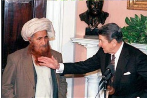
ربانی او مولوی خالص له ریگان سره په سپینه مانی کی

واک ته ورسیده او په پاکستان دیکتاتور ضیاالحق پر چوکی کښیناست، په افغانستان کی هم جهاد دوام درلود. په ورته وخت کی اخوان المسلمین په مصر، سوریه، فلسطین او نورو ځایونو کی پتې او ځواکمنې کړې، جوړې کړې، په ختیځ کی د دغو حرکتونو سر راپورته کول د رمضان د نه سترې کیدونکو هڅو پایله وه. سربیره پر دی چی اسلامپالنه اوس په خپلو پښو ولاړه وه، ولی زوروالی او سپین ریریری توب