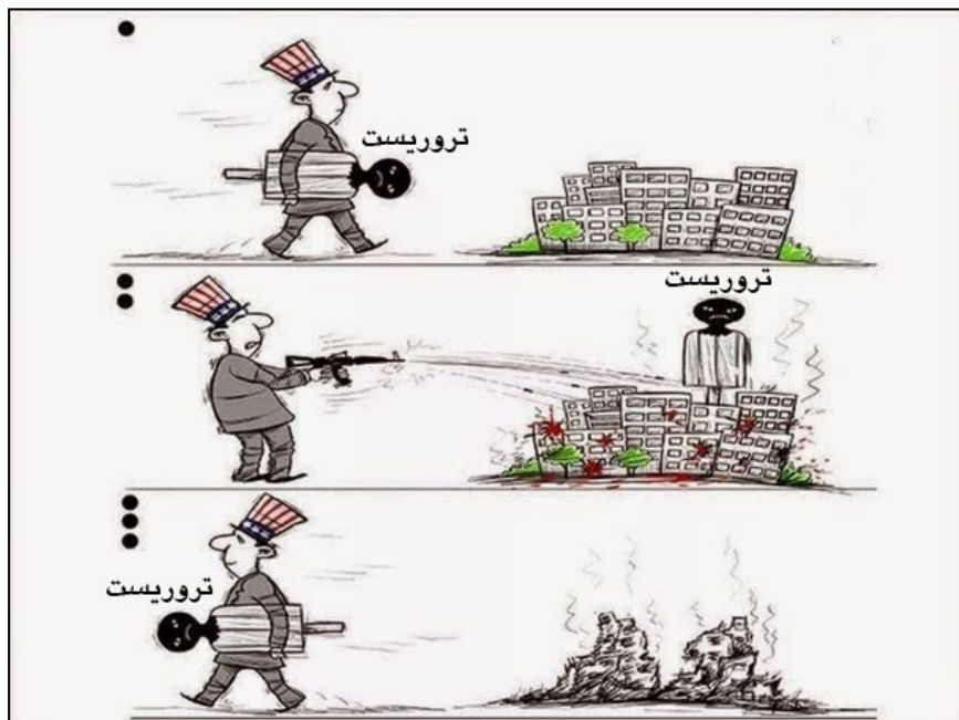
امریکا حامی و بانی اصلی تروریسم در جهان