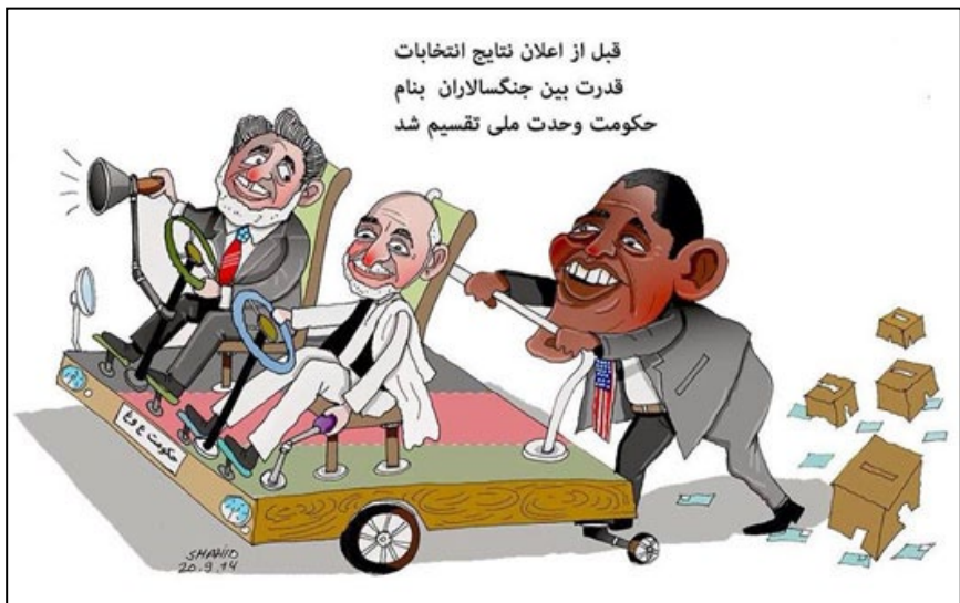
شرکت سهامی «ع» و «غ»